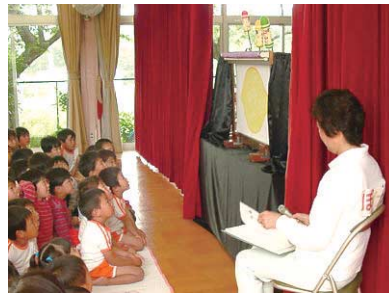
夢中で紙しばいを見つめる子どもたち

公演は、物語に合わせておもちゃや楽器などの効果音を加えたり、時には手作りのぬいぐるみやシャボン玉が舞台から飛び出す立体紙しばいになったりと「ぼけっと」ならではの楽しい演出で、子どもたちも大喜び。今回のしがぎん福祉基金の助成は、それらの紙しばい演出に必要な小道具の材料や公演の諸経費にあてられました。