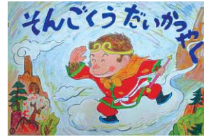
「ぼけっと」製作の拡大紙しばい

拡大紙しばいは通常の4倍の大きさで、約12枚の絵をメンバーが手分けして描き、今ではレパートリーも増えその数は50を超えるほど。