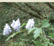
高島市マキノ町石庭