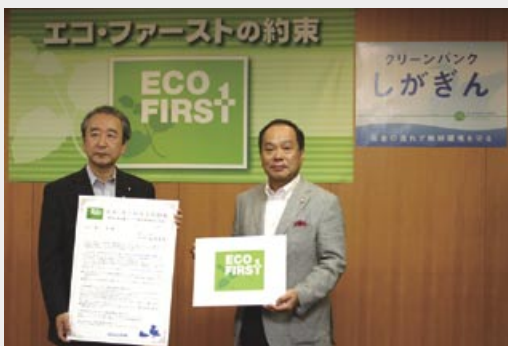
「エコ・ファーストの約束」を交わした鴨下一郎環境大臣と大道頭取(右)

これは、当行が「カーボンオフセット定期預金『未来の種』」をはじめとする、多種多様な環境配慮型金融商品を開発・提供するとともに、「エコビジネスフォーラム」の開催等を通じて、地域の環境ビジネスの支援に積極的に取り組んでいることが評価され認定に至ったものです。