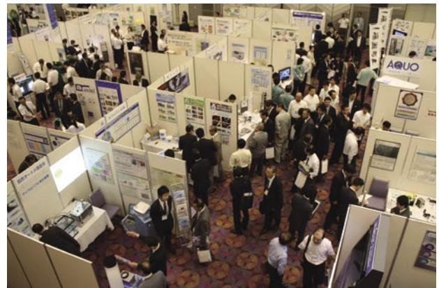
平成21年6月開催の「エコビジネスマッチングフェア」の様様

今年も6月に、出展ブースを120社・団体、出展分野も「アグリ・フードビジネス」を加え、規模を拡大して開催いたしました。お取引先の皆さまに「環境に特化」した商談と交流の場を提供し、今後の事業展開のヒントや新しいビジネスパートナーを見つけていただくことを目的としており、当日は約2,600人の来場と800件を超える商談が積極的に行われるなど、各ブースは終日にぎわいました。