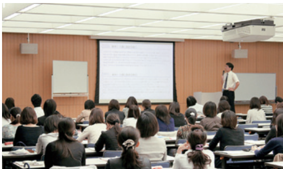
資産運用アドバイザー研修の風景

パーソナル出張所では、休日の資産運用相談（予約制）のほか、投資環境の現状や今後の見通し等についての「投資信託運用報告会」や「個人年金保険ご契約者セミナー」など、専門家による各種セミナーを開催。平成21年度はのべ83回開催し、お客さまの投資判断にお役立ていただきました。