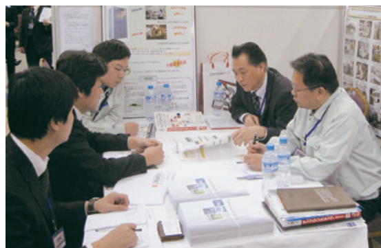
地場企業との熱のこもった商談

上海駐在員事務所は、300社を超えるお取引先の中国現地法人の「運営相談」、中国進出を検討されているお取