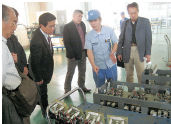
日系重電機メーカーを訪問（湖南省視察ミッション）

また平成22年2月には、中国に次ぐ生産拠点として注目されているタイへのミッションを実施しました。タイ投資委員会、日系企業が多数進出するロジャナ工業団地、滋賀県内企業の現地法人、日系大手自動車メーカーのほか、大手商業銀行カシコン銀行を訪問、お取引先に現地の投資環境を実感いただきました。