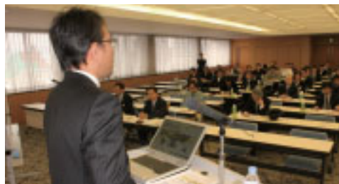
最新の海外ビジネス情報を熱心に聞く皆さん

インドへの進出や中国での販路開拓を検討されているお取引先を中心に、多数の皆さんが熱心にメモを取られていました。