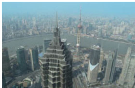
日本・中国間の貿易量は年々増加しています

また平成23年2月22日から、香港支店でも人民元建て業務の取り扱いを開始。増加する香港・中国本土間の決済に加え、香港での人民元建て融資取引や預金取引にもお応えできる体制となりました。今後も中国国内の規制緩和など動向を見極めながら、お取引先のニーズに応じたサービスの充実に努めます。