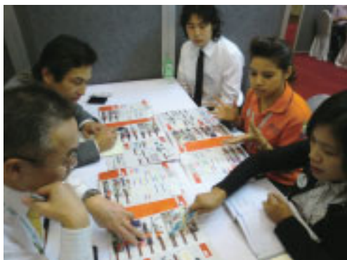
各ブースでは日系企業とタイの企業との間で熱心な商談が続きます

との取引が一層進み、タイは製造拠点としてますます重要度を増すものと予想されています。