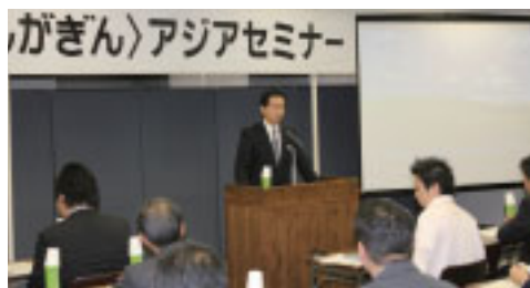
これからのアジア展望や実務に役立つ情報を提供しました

京都会場では、アナリストによる今後の為替相場について、また四日市会場では、世界トップシェアの精密小型モーター製造企業の担当部長が同社の海外展開の現状について講演。また両会場では、世界の市場へと変貌する中国の最新事情について情報提供しました。