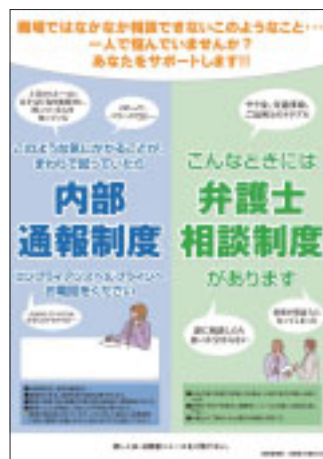
「内部通報制度」のポスター

また、役職員が法律問題に直面したとき、早期に問題が解決できるよう、弁護士相談制度を設けています。