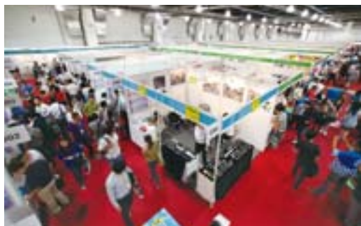
多くの来場者でにぎわう商談会、活発な商談が行われた

中国最大規模である本商談会は、中国で部材調達や販売拡大を図りたい日本の製造業者500社が出展し、中国企業向けにPR活動や商談を行いました。2日間で4,800社8,600人が来場され、15,000件の商談が展開されました。