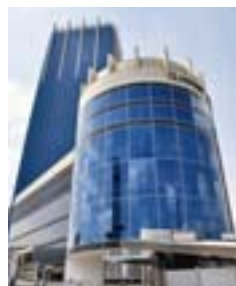
バンコク駐在員事務所が入居するビル

主な活動は①東南アジア諸国への進出、投資などを計画されているお取引先へのアドバイス②現地法人設立のご支援③タイを中心とする東南アジアの金融市場の動向調査、などです。