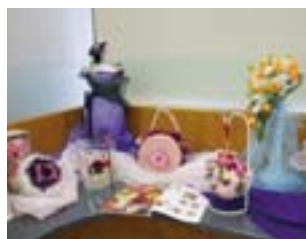
プリザーブドフラワー (スタジオスイートピー様) 草津支店

作品をご覧のお客さまからは、「この教室に通ってみたい」「ロビー展を見て私もはじめました」などのご感想をいただくなど、地域の新しいつながりが生まれる場になっています。