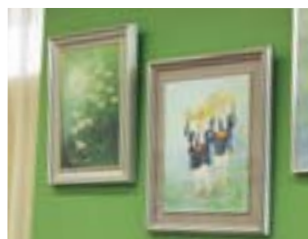
ちぎり絵 (森田としゑ様) 瀬田駅前支店