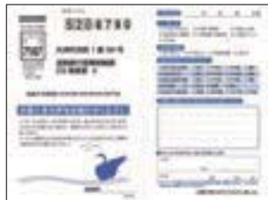
コミュニケーションカード

当行では本支店内に設置している「コミュニケーションカード」や電話でのご意見・ご要望の受付のほか、郵送による「お客さまアンケート」を定期的を実施することにより、お客さまの声を収集・分析し、サービスの改善・向上に反映させています。