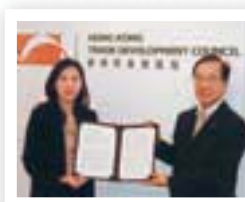
香港貿易発展局との調印式

平成25年7月にメトロポリタン銀行(フィリピン)、平成25年9月に近畿地銀で初めて香港貿易発展局(香港)と、平成25年12月にベトナム銀行(ベトナム)と業務提携等を締結しました。