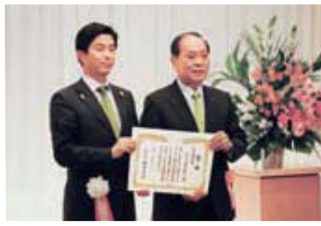
環境コミュニケーション大賞授賞式

環境省等が主催する「第17回環境コミュニケーション大賞」で「CSRレポート2013歩みを、共に。」が最高位の「環境報告大賞」を、テレビCM「ニゴロブナ・ワタカ放流」篇が「優秀賞」を受賞しました。ダブル受賞は初めてです。