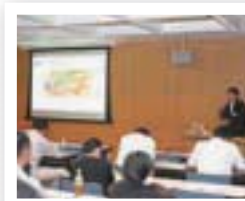
“農・食”販路拡大セミナー

“農・食”販路拡大セミナーでは、食材や商品のPR方法等を講演。6次産業化セミナーは6次産業化の普及・啓発を目的に開催しました。