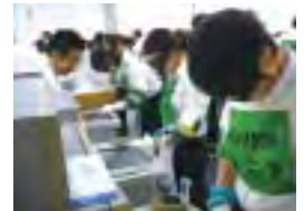
高齢者疑似体験講座

より多くのお客さまにご利用いただきやすい銀行を目指し、「高齢者疑似体験講座」や「AED講習」、「認知症サポーター養成講座」等で、高齢者や身体の不自由な方への心配りや救急時の適切な対応を学んでいます。