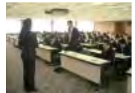
全店対象CS推進会議

また、CS推進活動を指揮する「CS推進リーダー」を全部店に配置するなど、「お客さま満足度向上への取り組み」を本部・営業店一体で取り組んでいます。