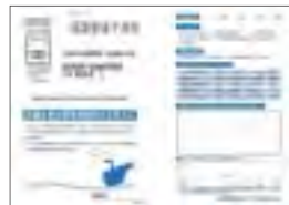
コミュニケーションカード

当行では各本支店内に設置している「コミュニケーションカード」や電話でのご意見・ご要望の受付のほか、郵送による「お客さまアンケート」(個人・法人向け)を定期的実施することにより、お客さまの声を収集・分析し、サービスの改善・向上に反映させています。