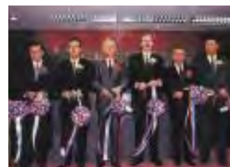
香港支店の開設式(平成5年9月)