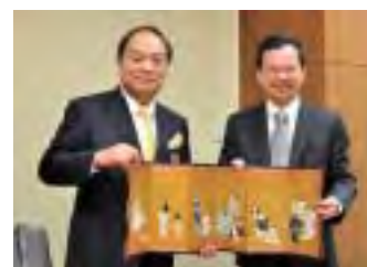
バンコク駐在員事務所の開設にともない タイ中央銀行を表敬訪問 (平成24年2月)