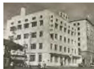
新築当時の京都支店(昭和36年1月)