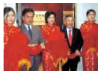
上海駐在員事務所の開設式 (平成15年12月)