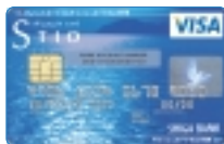
Lake Blue <レイクブルー>