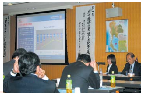
第24回「アジアセミナー」