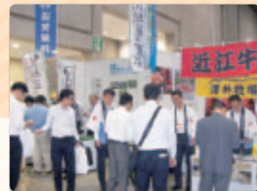
滋賀県の逸品に来場者の皆さまは舌鼓を打たれました

平成24年10月23日～24日に、東京ビッグサイトで開催された「地方銀行フードセレクション2012」に参加し、当行のお取引先2社にご出展いただきました。