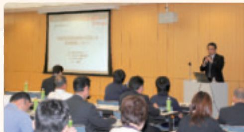
熱心な質問が飛び交いました

平成24年7月に開始された「再生可能エネルギーの固定価格買取制度」により、メガソーラーの建設計画が相次ぐなど、特に太陽光発電についてお取引先の関心が高いことから、制度に対する取組状況や、太陽光発電設備の導入事例、電力会社との電力購入契約手続や留意事項など、実例を交えた情報を提供しました。定員を大きく上回る盛況ぶりでした。