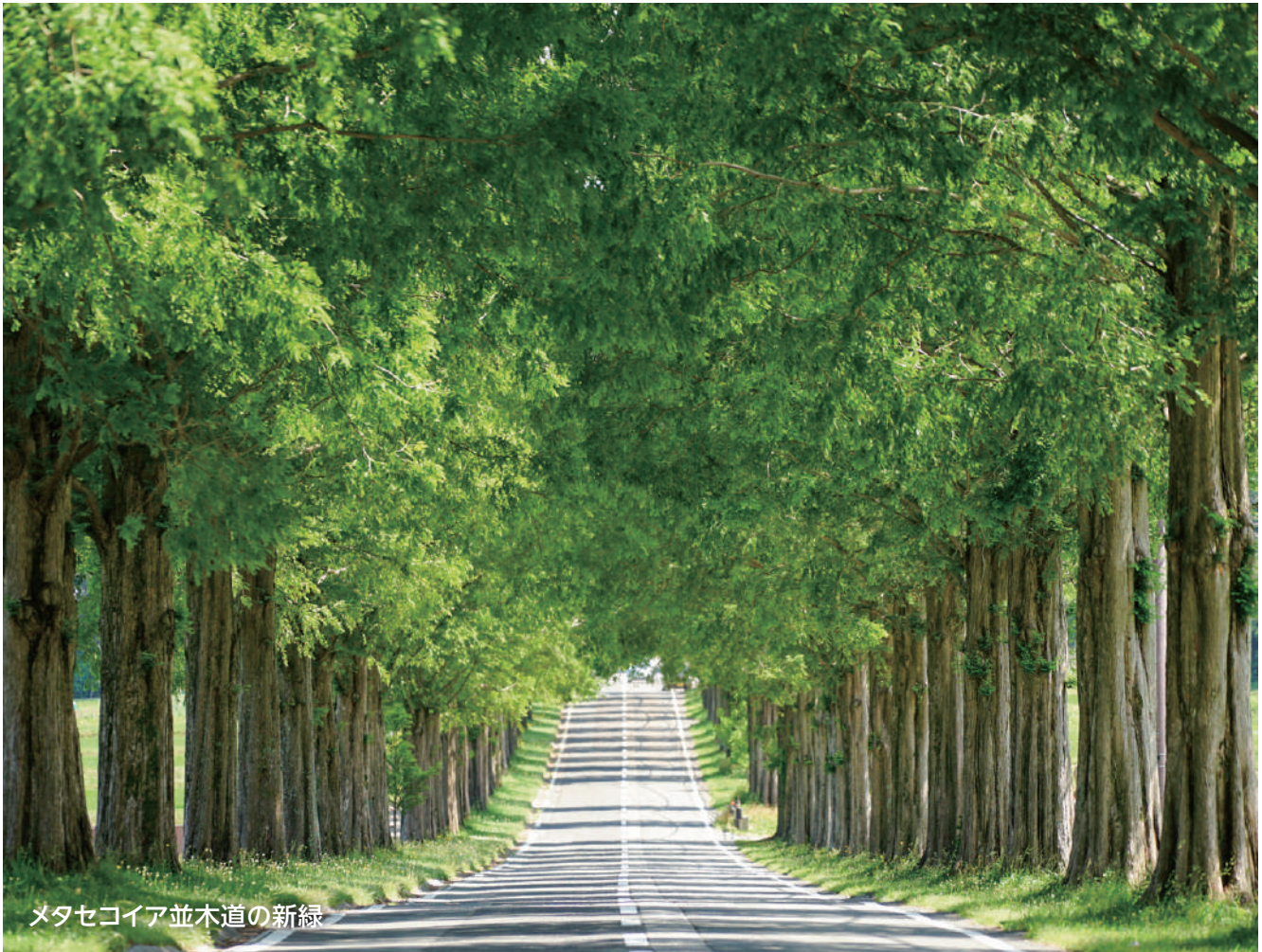
メタセコイア並木道の新緑