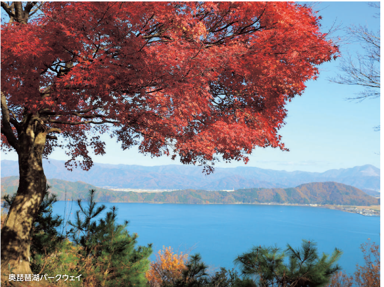
奥琵琶湖パークウェイ