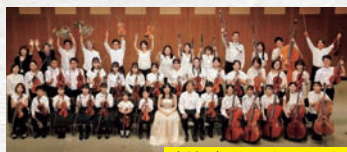
大津ジュニアオーケストラ